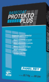
RECUBRIMIENTO BASE PROTEKTO PLUS 22.7 KG.