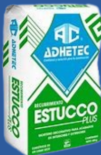
ESTUCCO ADHETEC PLUS 25 KG.