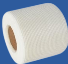
CINTA FIBRA DE VIDRIO ESTANDAR DE 3"X 150 PIES