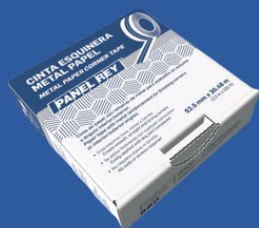
CINTA ESQUINERA METAL PAPEL PANEL REY 52.5MM X 30.48M