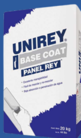
UNI REY BASECOAT PRESENTACION 20 KG.