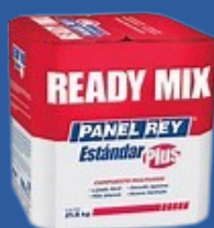
COMPUESTO MULTIUSOS READY MIX ESTANDAR PLUS 21.8 KG.