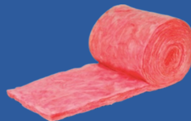
AISLAMIENTO R-11 DE 3.5" 50 PIES