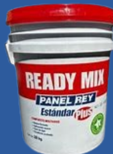
COMPUESTO MULTIUSOS READY MIX ESTANDAR PLUS 28KG.